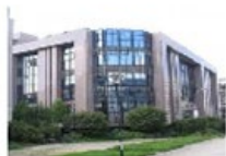
De Raad van de EU