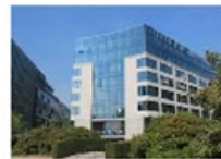
European External Action Service